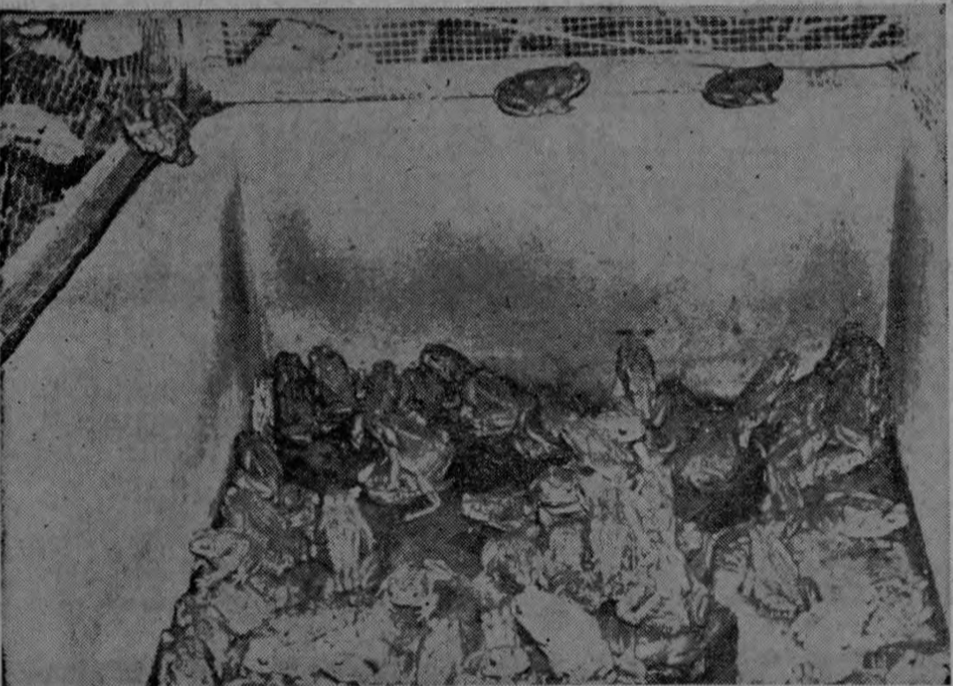
HE AQUI UN CENTRO "SAPIFERO" DE COSTA RICA. —2.000 sapos dispuestos a dar grandes alegrías y disgustos a las futuras mamás. En aquel marzo, los repulsivos animales

entraron por la puerta grande a la posteridad mediante la siguiente frase de Galli-Mainini: "Che, son "macanudos" para demostrar el embarazo"... ¡Y siguen siendo "macanudos"!