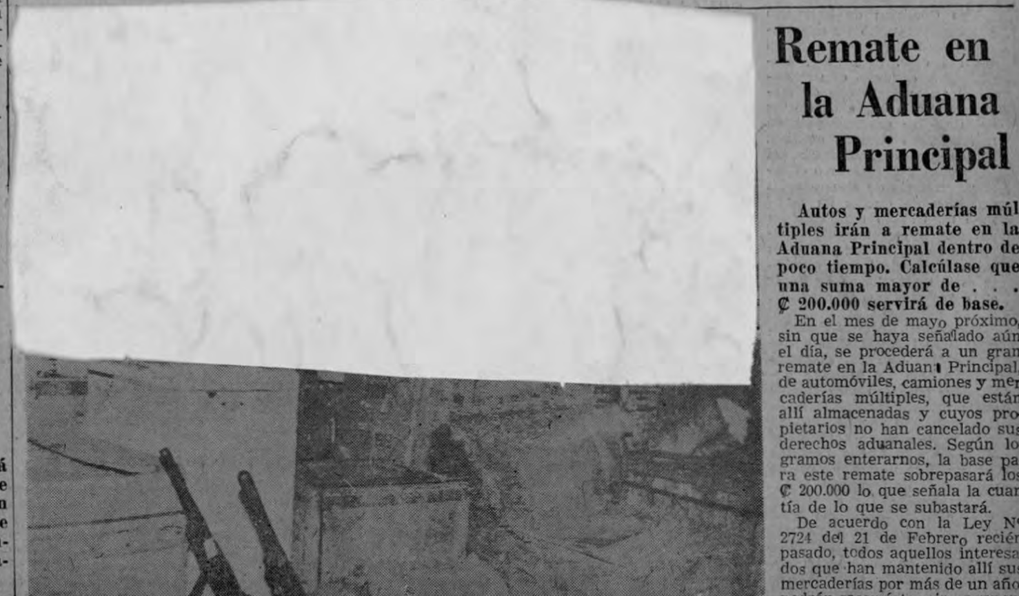
REMATE DE AUTOMOVILES, CAMIONES Y MERCADERIAS.— Las gráficas presentan: arriba; automóviles, camiones y autobuses que serán rematados dentro de poco,

En la capital de la vecina y hermana República de Panamá, se celebrará en los días comprendidos entre el 10 y el —Pasa a la Pág. CUATRO